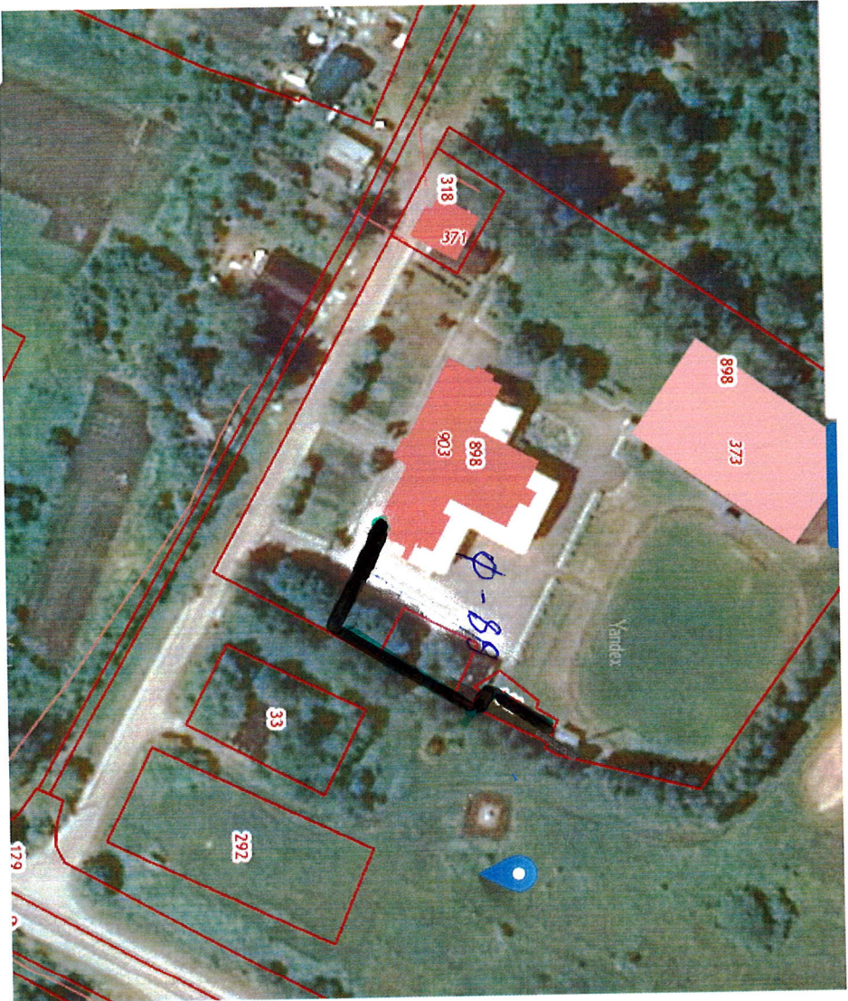
Схема теплоснабжения Большеприиваловского сельского поселения Верхнехавского муниципального района Воронежской области